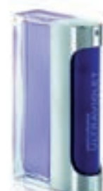
39,9€ Rabanne Ultraviolet