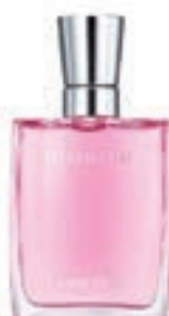
39,9€ Lancôme Miracle