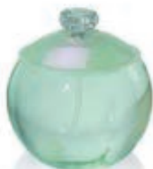
39,9€ Cacharel Noa