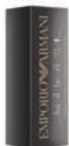
49,9€ Armani Emporio