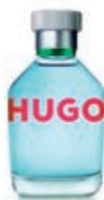
29,9€ Boss Hugo