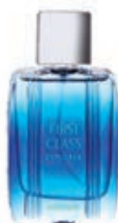
19,9€ Aigner First Class