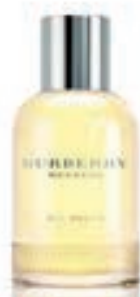
29,9€ Burberry Weekend