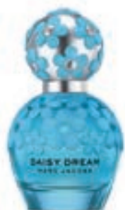
49,9€ Marc Jacobs Daisy Dream