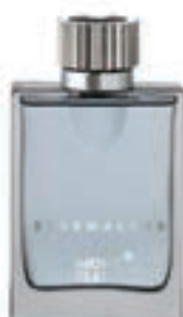
39,9€ Montblanc Starwalker