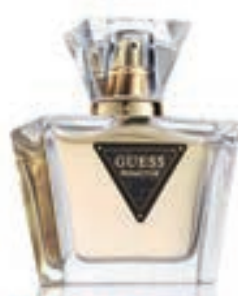
19,9€ Guess Seductive

Products available in our onboard stores