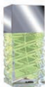
19,9€ Ajmal Vision