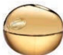
29,9€ DKNY Golden Delicious