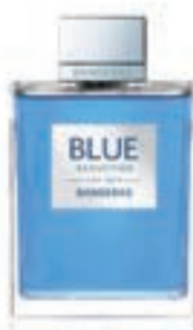
29,9€ Banderas Blue Seduction