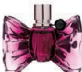
49,9€ V&R Bonbon